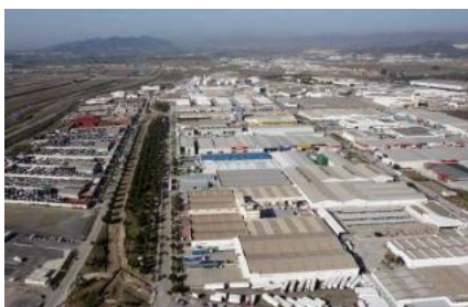
El polígono Guadalhorce sí tendrá cámaras de vigilancia.

El Ayuntamiento de Málaga volverá a intentar llevar la videovigilancia a todos los polígonos de la ciudad. Será el tercer intento, después de que en las dos peticiones anteriores sólo consiguiera que el Tribunal Superior de Justicia de Andalucía (TSJA), que tiene la competencia para autorizar su instalación, aprobase el proyecto para tres recintos empresariales: Guadalhorce, Azucarera y Santa Bárbara.