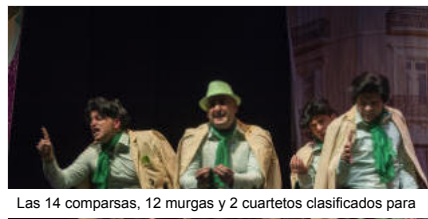
Las 14 comparsas, 12 murgas y 2 cuartetos clasificados para